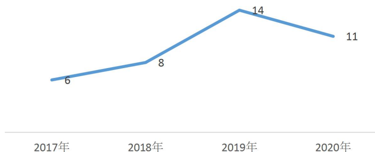
依申请公开办理情况

2020年，我委收到公开政府信息申请11件，其中，网上申请8件，信函申请3件，申请人类别为公民或法人。本年度已按时答复11件，其中“同意公开”的4件，占36.4%；“部分公开”的1件，占9.1%；“信息不存在”的6件，占54.5%；按时答复率100%。