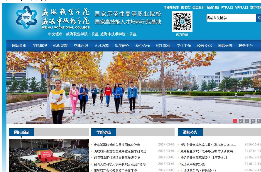
(威海职业学院主页)