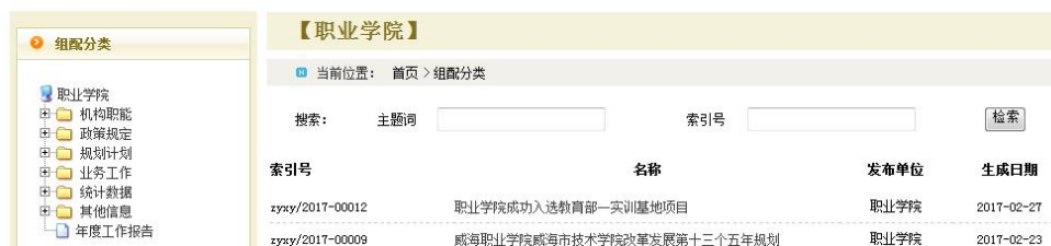
(威海职业学院政府信息公开网页)