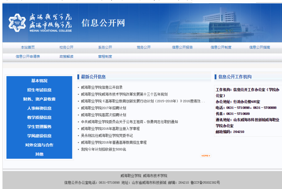
（威海职业学院信息公开网）

2016年学院将信息公开工作设为学院重点督办事项，确保信息公开工作取得实效。学院继续严格认真执行教育部《高等学校信息公开事项清单》（〔2014〕23号，以下简称《清单》）文件，根据文件要求，一方面进一步完善学院信息公开网，持续更新“校务公开”、“系务公开”、“党务公开”专栏，增强管理透明度，另一方面严格参照《威海职业学院信息公开基本事项清单》《威海职业学院系部信息公开基本事项清单》，实时全面更新信息，学院的重大事项及涉及教职员工和学生切身利益的事项得到及时有效公开。