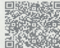
工程质量监督登记证书