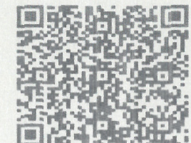
消防设计审查意见书